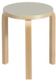
Stool 60 三腳圓凳

創立於 1935 年的 Artek 為芬蘭設計家具的代表品牌，由「北歐現代主義之父」Alvar Aalto 所領導成立，品牌內所生產之作品大多出自於 Alvar Aalto 的靈感，結合現代先進技術與傳統手藝製成，融入自然與建築思維、延展構思家具的新形態。